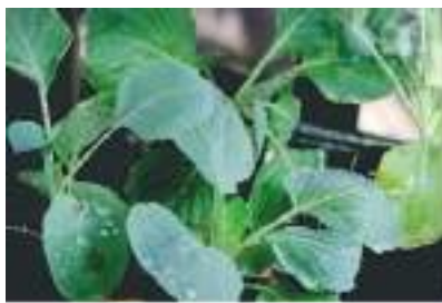
Экишга тайёрланган кўчатлар

Кўчатхоналарда ерда ўстирилган усулга нисбатан 5x5x5, 6x6x6, 7x7x7, 8x8x8 см ўлчамли озиқали тувакчаларда гулкарам кўчати етиштирилганда энг яхши натижаларга эришилган. Энг яхши натижалар 8x8x8 см ли тувакчаларда кўчат етиштирилганда олинган. 45 кунлик кўчатлар кўчириб ўтқазишга тавсия этилади.