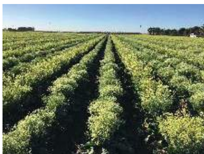
Ёппасига гуллаган гулкарам ўсимликлари (Термиз, 2020)

Сурхондарё вилояти шароитида ҳам гулкарам уруғчилиги технологияси ишлаб чиқилган. Бунда уруғлар 10 сентябрда сепилганда ва кўчатлар декабрь ойининг иккинчи ўн кунлигида плёнкали қопламалар остига кўчириб ўтқазилганда кафолатланган