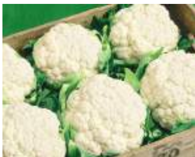
Пишиб етилган ва йиғиб олинган гулқарам бошлари