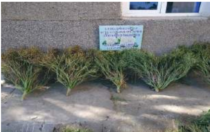
Йигиб олинган гулқарам уруғлик ўсимликлари

Юқоридагилардан келиб чиқиб Ўзбекистон шароитида гулқарам уруғчилигини ташкил этиш ва ушбу экин селекцияси билан шуғулланиш мумкинлигини таъкидлаш мумкин.