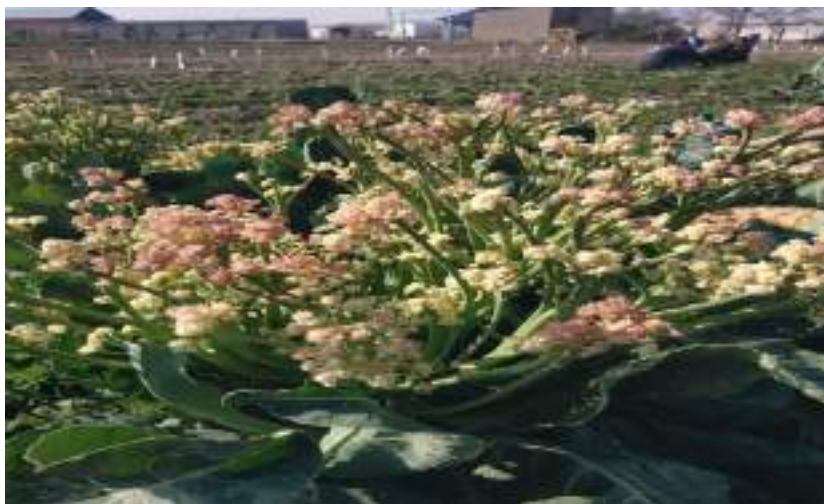
Уруғлик ўсимликларда гулпояларнинг ҳосил бўлиши